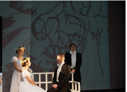
Сцены из спектакля «Евгений Онегин»

ны, произносит уже другая актриса. То же самое и с Онегиным – вот он, молодой, холодно отвечает на письмо Татьяны, и вот Онегин, только вернувшийся из путешествия, падает к ногам