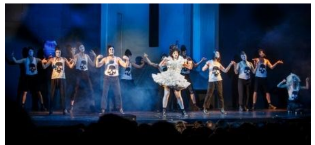
Кадры из спектакля «Опера нищих»