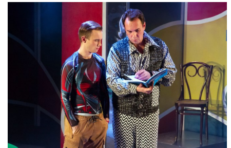
Кадры из спектакля «Железяка или училка из далёкого будущего»