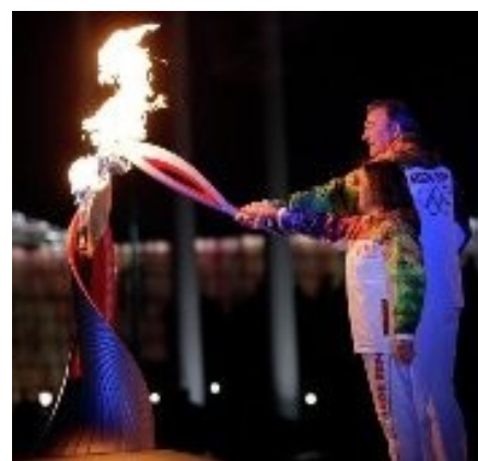
Чашу олимпийского огня зажгли Владислав Третьяк и Ирина Роднина...

нести факел к светильнику, который будет «хранить» в течение игр, доверяют